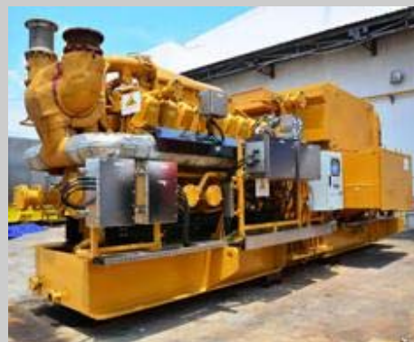
Cat 燃气发电机组 G3520C

Sime Darby Industrial, Power Systems (SDI-PSD) 将为沙巴州-沙捞越天然气管网项目提供一台油田用 Cat G3520C (1800kW) 和一台 Cat G3306 (88Kw) 燃气发电机组 (GEG)。这两台发电机组将根据客户的特定要求由卡特彼勒进行自定义装配，届时将为民都鲁地区办事处 (BRO) 和民都鲁计量站 (BMS) 提供电源，由马来西亚国家石油公司 Petronas Gas Berhad 监管运营。