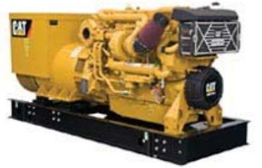
Cat C18 ACERT 发电机组

今年 6 月，亚洲顶尖工程服务公司 ST Engineering 旗下子公司之一 Singapore Technologies Marine (ST Marine) 宣布，它已成功接获太古海洋开发公司 (Swire Pacific Offshore) 价值 1.71 亿 S$ 的造船合同，为该公司打造 4 艘锚作拖轮 (AHTS)。