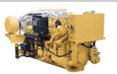
Cat 3512C ACERT 发电机组