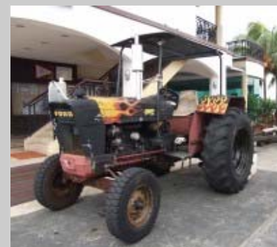
Ford Tractor 5000"

新加坡武装部队游艇俱乐部（SAF Yacht Club）旗下拥有 270 艘游船，在樟宜和三巴旺俱乐部设有公众游船停泊区。为了帮助公众将游船移至水里，SAF Yacht Club 采用了一台 Ford 5000 拖拉机（绰号为“Grandpa”）来协助运作。如今，这台 Grandpa 已运营超过 30 年，为俱乐部带来的投资回报率超过一百倍。随着时间的推移，俱乐部需要一台能满足多种传统和现代游船需要的拖车来满足新的需求，因此，俱乐部决定让 Grandpa 退休，另外购置一台新型纽荷兰 Ford TL90 来代替 Grandpa 投入运作。