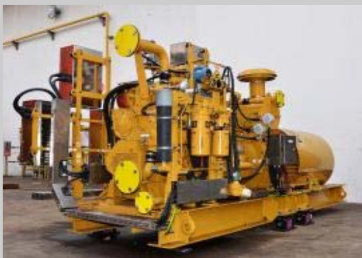
Cat 燃气发电机组 G3306

天然气发电可为马来西亚的经济发展做出积极的贡献，如推动相关行业的发展、保持马来西亚 LNG 工厂的天然气出口优势、促进天然气领域的快速发展以及提高天然气资源的供应和储备。在国内市场，沙巴州-沙捞越天然气管网项目的发展将可为沙巴州带来稳定持续的天然气供应，并且有助于周边地区经济活动的开展和经济繁荣，与此同时，对民都鲁区域的天然气生产和产量的保持也起了积极的作用。随着国家的进步以及能源状况的进一步恶化，马来西亚将会继续支持和执行有利于本地经济发展的能源政策。马来西亚目前正在执行的能源政策包括可再生能源的推广，因为马来西亚在未来的十年中将有可能变为燃油进口国。