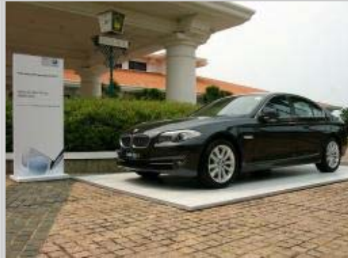
左-右：TSL 的嘉宾正在询问捐款事宜；一杆进洞奖品-宝马 BMW523i-由 Performance Motors Limited 赞助

Tractors Singapore Limited (TSL) 于 2011 年 9 月 9 日在圣淘沙高尔夫俱乐部举办第 9 届客户高尔夫比赛暨晚宴。