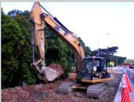
Cat 320D 正在执行路面维护工作

Samwoh Corporation Pte Ltd (Samwoh) 从 20 世纪 70 年代早期的一个小型企业发展到今天拥有几家子公司的企业集团，一直坚持自己独特的发展方针，认真秉承经营理念“一站式服务”。目前 Samwoh 的主要业务分支有：土木工程、基础设施建设、公路/飞机和海港路面建筑及保养、建筑材料供应商、专业的爆破服务、建筑和工业垃圾回收、研发以及顾问服务等。Samwoh 认为，他们之所以能始终获得成功并保持行业领先地位，与他们的专业团队和优质设备是分不开的。