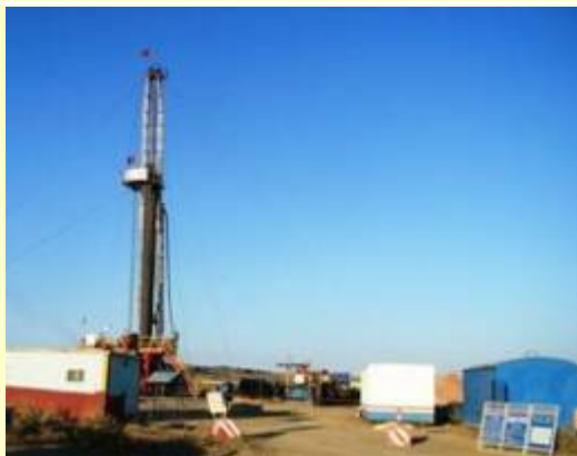
西部钻探 7000 米钻机

西部钻探工程有限公司隶属于中国石油天然气集团公司（CNPC），总部设在新疆乌鲁木齐市，是按照集团公司集约化、专业化、一体化思路组建的一家专业化钻探公司。公司是集钻井、测井、录井、固井等石油工程技术服务、石油工程技术研究为一体，跨国、跨地区的大型国有企业。截至 2009 年底，公司资产总额 112 亿元，拥有员工 2 万多人，各类服务队伍 456 支，大型工程技术服务设备 655 台（套），年钻井能力 400 万米，测井能力 10000 井次，录井能力 3000 口，具备支撑西部和中亚地区油气业务发展的雄厚实力。