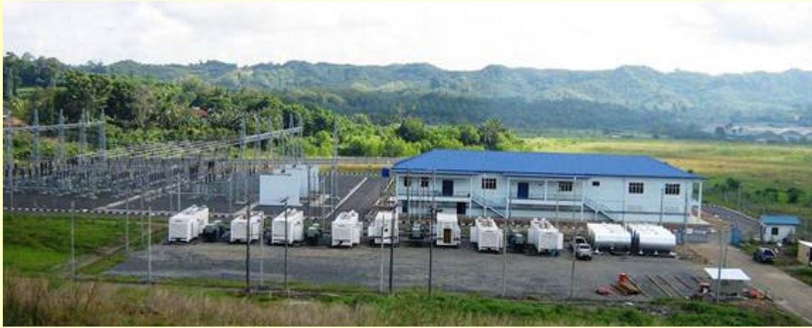
可靠的 Cat 发电机组正在沙巴州内陆地区提供电力供应

电力供应的可靠性可通过系统平均停电持续时间 SAIDI 来评估和测试。它是指每个由系统供电的用户在一年中所遭受的平均停电持续时间，通常用分钟来表示。能源、绿色工艺及水务部的任务是确保沙巴州的 SAIDI 能从 2009 年的每用户 2867 分钟减少到每用户 700 分钟，而这一任务也作为陈华贵部长 2010 年的主要工作考核指标（KPI）。