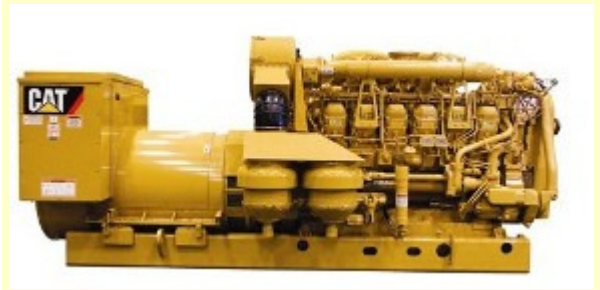
Cat 3512B(1200 KW) 发电机组

西部钻探工程有限公司隶属于中国石油天然气集团公司（CNPC），总部设在新疆乌鲁木齐市，是按照集团公司集约化、专业化、一体化思路组建的一家专业化钻探公司。公司是集钻井、测井、录井、固井等石油工程技术服务、石油工程技术研究为一体，跨国、跨地区的大型国有企业。截至 2009 年底，公司资产总额 112 亿元，拥有员工 2 万多人，各类服务队伍 456 支，大型工程技术服务设备 655 台（套），年钻井能力 400 万米，测井能力 10000 井次，录井能力 3000 口，具备支撑西部和中亚地区油气业务发展的雄厚实力。