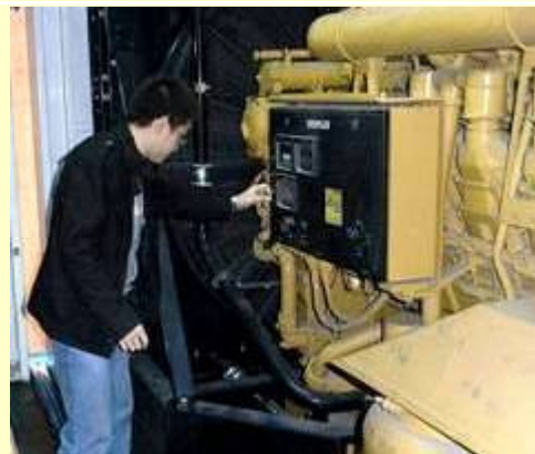
CEL 工作人员正在检查发电机组状况

作为信昌机器的长期合作伙伴，西部钻探曾与信昌合作多次，对卡特彼勒产品，特别是 Cat 3512B 发电机组已有充分的了解。在这次项目中，西部钻探优先考虑的因素是功率需满足负荷的动力需求，而他们也十分肯定和自信信昌机器能完全达到他们的要求。2011 年 4 月，西部钻探正式与信昌机器签订 26 台 Cat 3512B 发电机组，其中 20 台计划应用于塔里木油田的 7000 米钻机上，而另外 6 台将被南北疆油田的 5000 米钻机所采用。此项目创造了信昌机器与西部钻探的最佳合作记录，是继 2007 年西部钻探 17 台 CAT 3512B 发电机组之后成交量最大的一次合同。