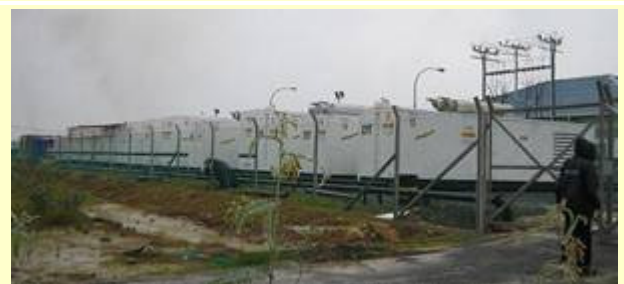
SDI 为 SESB 提供的发电机组现场照

此外，沙巴电力有限公司（SESB）也已经做出巨大努力加强和改善现有的电力系统，目的在于提高该地区的发电能力，以及电力供应的稳定性和可靠性，以满足未来该地区不断增加的用电需求。