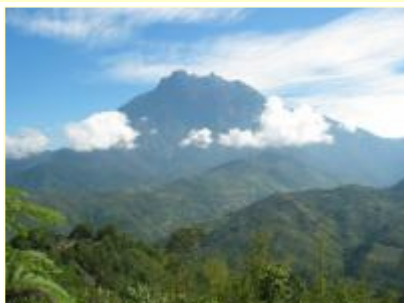
世界文化遗产-基纳巴卢山 (4095m) (马来西亚境内高峰，亚洲第四高峰)